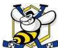
HC LA CHAUX-DE-FONDS